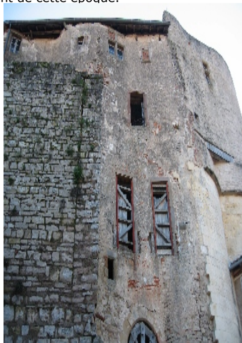
Courtine festonnée en prolongement de la porte