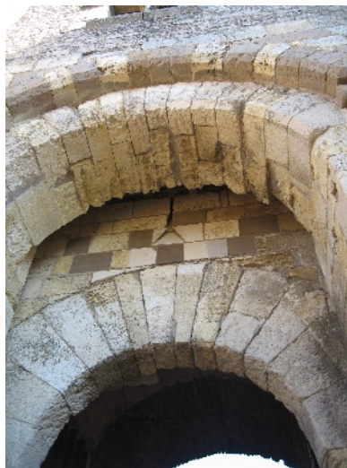
Assomoir et archère